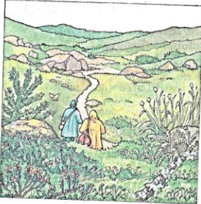
Dans la lande .

langage (nom masc. : le langage ). 1. C'est l'ensemble des mots, des phrases. Grâce au langage, tu peux dire ce que tu penses, tu peux parler avec les autres. 2. Les animaux ont aussi leur langage, c'est-à-dire leur manière de se faire comprendre.