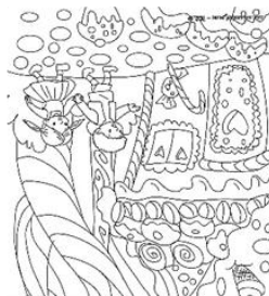
Hansel et Gretel