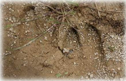
Empreintes de mammifère avec des sabots

Imagine pourquoi l'animal s'est déplacé, essaie de suivre sa trace.