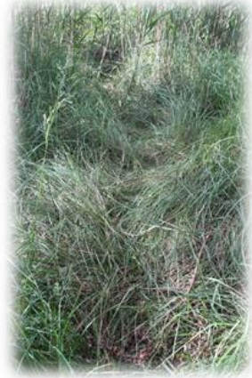
Coulée : passage habituel d'un animal