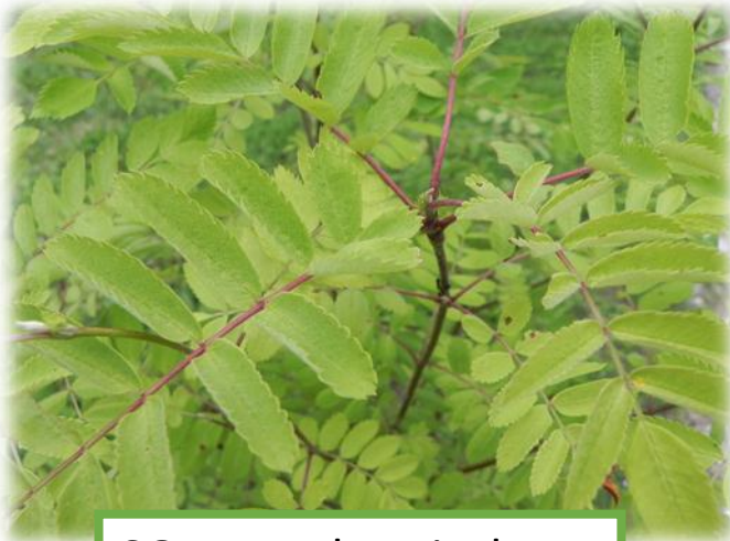
SORBIER des oiseleurs

Le sorbier peut atteindre une dizaine de mètres de hauteur.