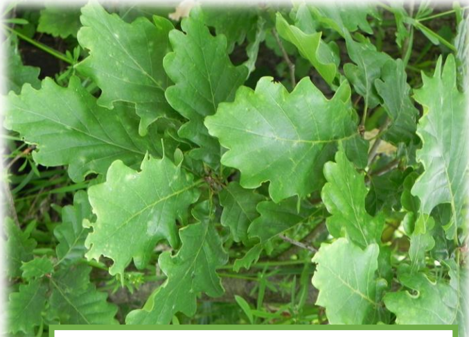
CHÊNE à feuilles caduques*

Il existe deux sortes Les chênes à feuilles caduques (dont les feuilles tombent en automne). Ils sont généralement plus grands. Leurs feuilles sont crénelées. Les chênes à feuilles persistantes comme le chêne vert et le chêne liège (on en trouve dans le sud de la France). Le bord de leur feuille est lisse ou avec des dents épineuses.