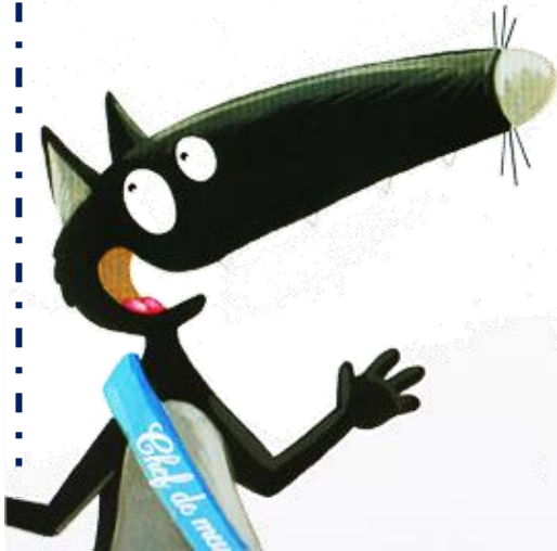
La première de couverture