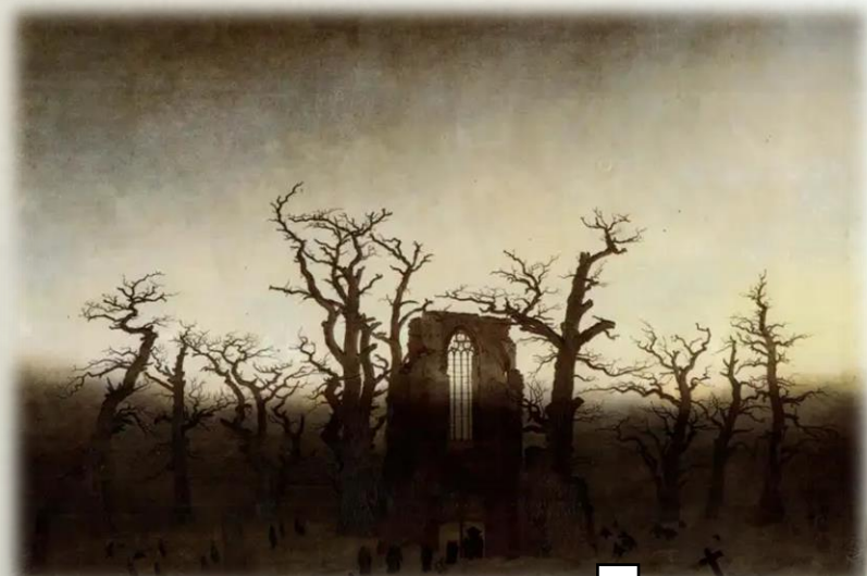
L'Abbaye dans une forêt de chênes peint en 1809-1810. Le tableau représente un pan de mur d'une abbaye en ruine, au milieu d'une forêt d'arbres morts.